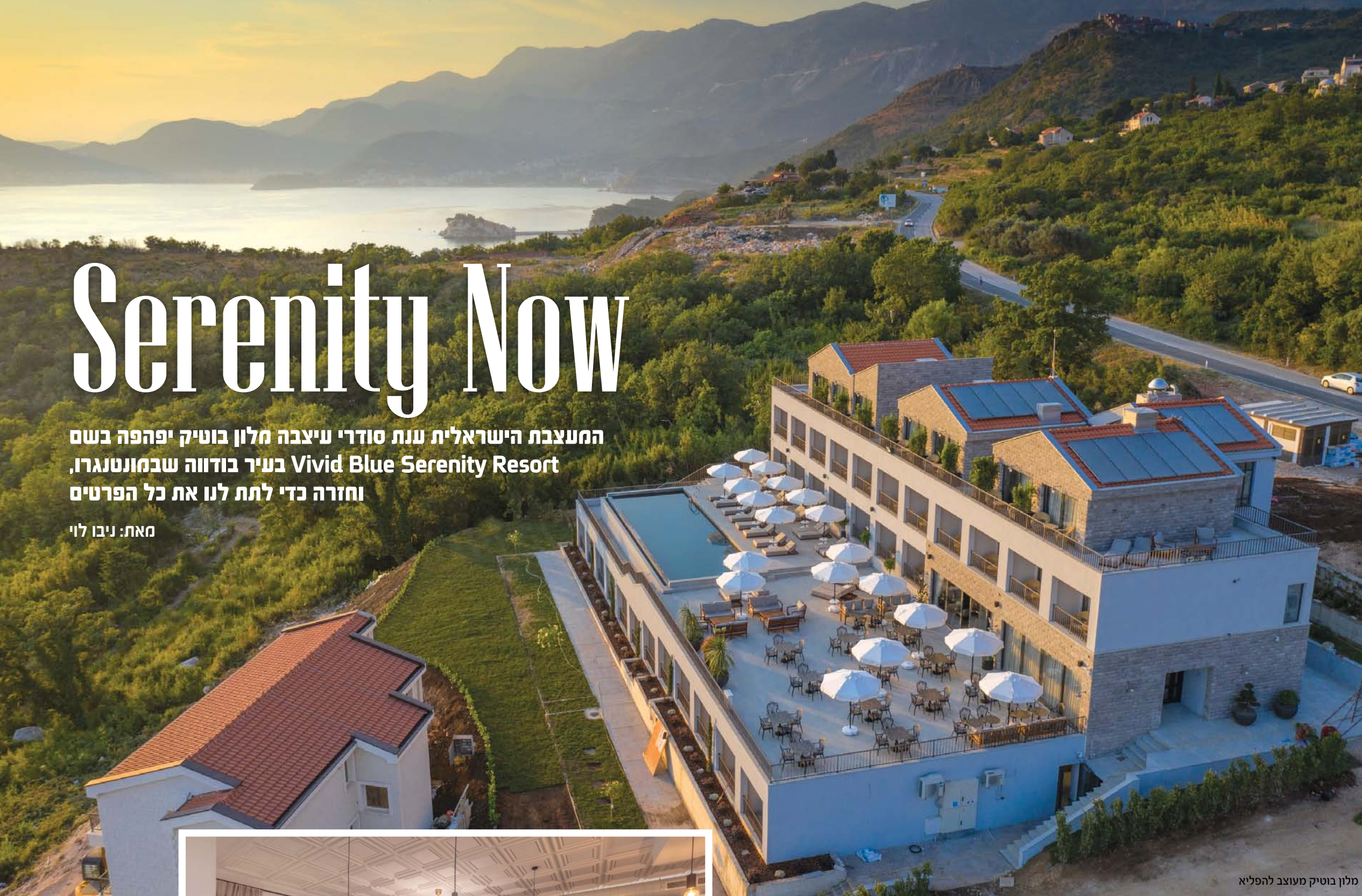
מלון בוטיק מעוצב להפליא