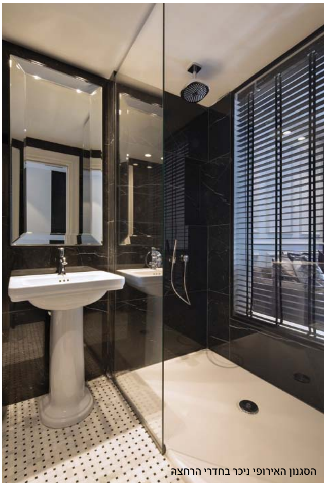
הסגנון האירופי ניכר בחדרי הרחצה