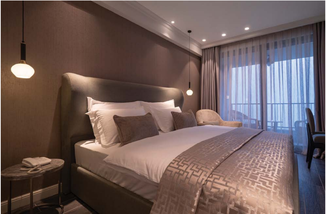
בכל קומה עוצבו חדרי השינה בסגנון שונה