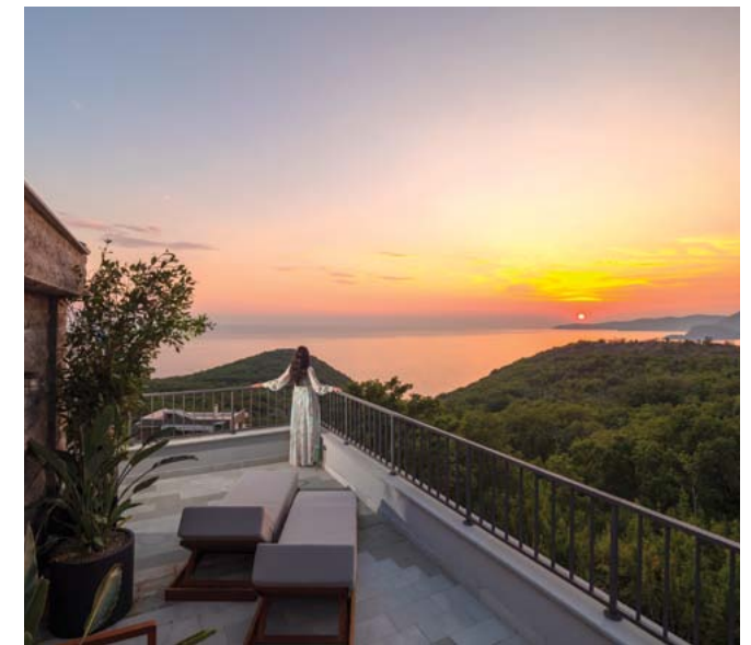
נוף מרהיב של הר וים